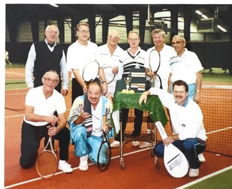
Foto A. De oprichters en deelnemers van het eerste uur.

De heren van het MMTTT zijn ook wel in voor een 'geintje'. Zo hebben verschillende heren verkleed deelgenomen aan een dames evenement, waarbij de organisatrice in eerste instantie niet doorhad dat het eigenlijk mannen waren (zie foto B).