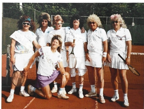
De 'dames' in kwestie.

Al gauw bleek dat er animo was om aan te sluiten bij deze MMTTT. In 1992 waren er al 14 spelers actief en in de loop der jaren werden dat er meer en meer.